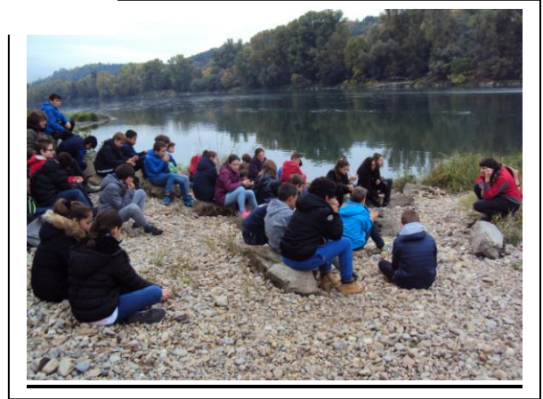
Au bord du Rhône pour écouter la légende de la Tarasque

L'après-midi, avec une animatrice de la FRAPNA nous avons rencontré le monde des décomposeurs, petits êtres vivants contribuant à l'équilibre de cet écosystème.