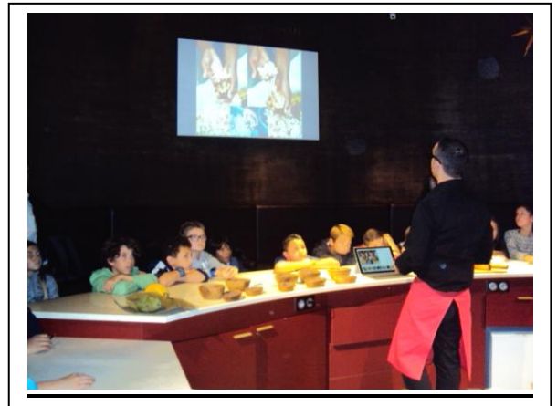
Atelier : La découverte du cacao