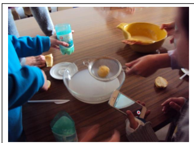
La fabrication du beurre