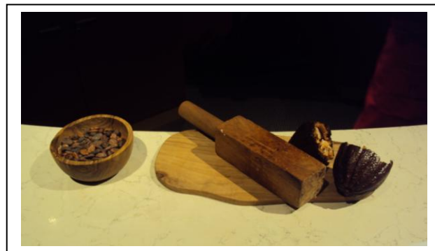
La cabosse et les fèves de cacao

La diététicienne de notre service de restauration CORALYS, a initié les élèves à la lecture des étiquettes alimentaires et leur a expliqué les apports nutritifs des différents types de chocolat.